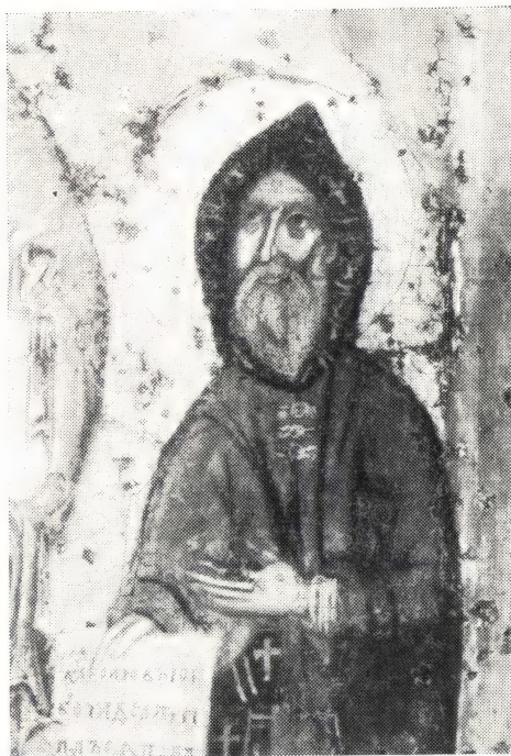
Начальник русского монастыря — Преподобный Антоний Печерский († 1073). Икона XIII века

Например, 1030 годом помечена «чистая и неизменная купчая» о продаже келлии «монаху Феодулу, игумену обители Пресвятой Богородицы Кси-